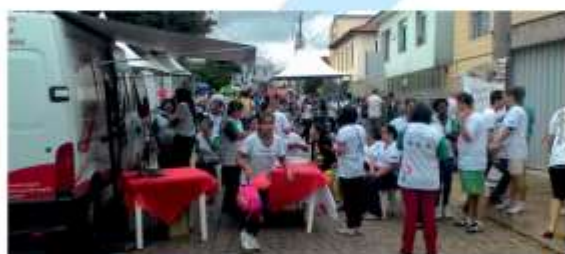
Desterro de Entre Rios