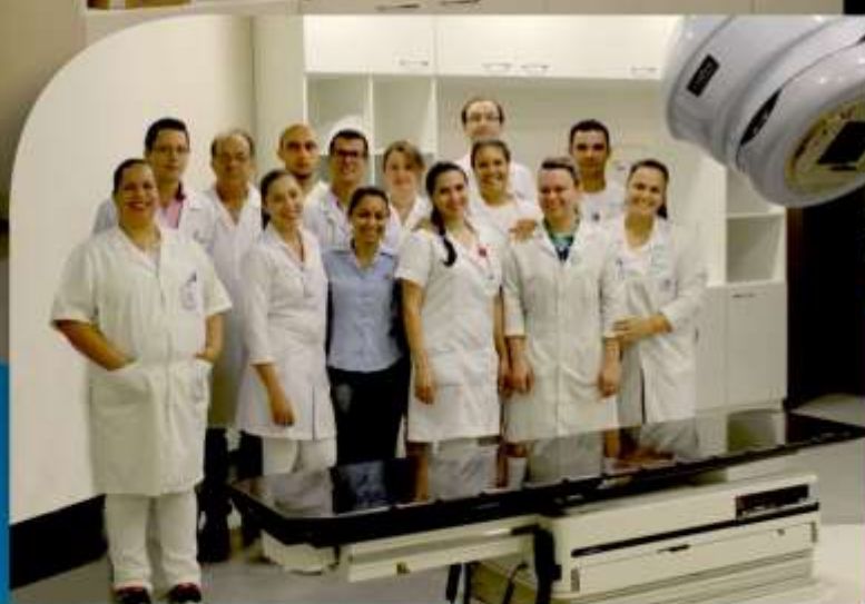
Atual Equipe de Radioterapia do Hospital do Câncer

Você ajudou a realizar este sonho e faz parte desse projeto!