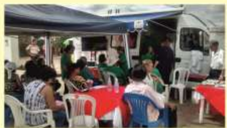
Cedro de Abaeté