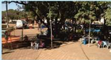
Morada Nova de Minas