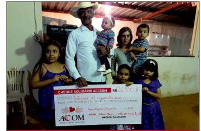
BAMBUÍ - MG

O Rotary Clube de Carmo do Cajuru é um parceiro da ACCCOM, que acompanha sua caminhada há muitos anos e, sendo uma instituição que preza pela ajuda ao próximo, mais uma vez, nos contempla com um lindo gesto de solidariedade. As Senhoras Rotarianas, fundadoras da Casa da Amizade, reuniram durante seus eventos e ações beneficentes uma doação no valor de R$500,00, que foi destinada aos pacientes da ACCCOM. Deixamos nosso muito obrigado, em nome de todos os pacientes.