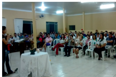
SÃO SEBASTIÃO DO OESTE - MG