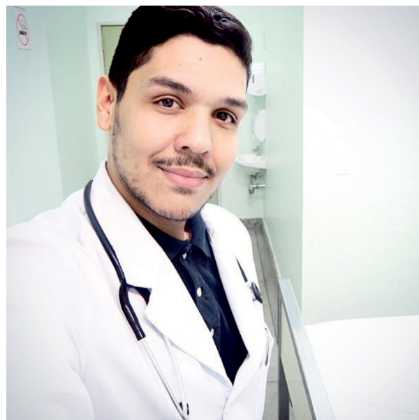
Membro Titular da SBOC - Sociedade Brasileira de Oncologia Clínica, CRM-MG 50274

Oncologista do Hospital do Câncer/ACCCOM