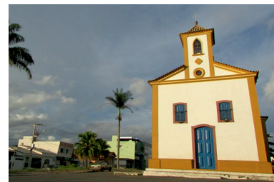
SÃO FRANCISCO DE PAULA - MG

A solidariedade é algo que tem o poder de mover todo o mundo e é nosso dever exaltar essas ações, como a realizada pelo Conselho Particular São Sebastião do Oeste, que após um Terço à Nossa Senhora da Conceição, foi feito um leilão beneficente à ACCCOM, além de outras doações espontâneas que juntas somaram o valor de R$750,00. Os pacientes da ACCCOM agradecem imensamente pela doação.