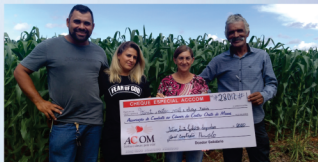
Forró e Leilão da Fazenda Santa Isabel

Agradecemos a todos os envolvidos nestes gestos de solidariedade que muito contribuiu com o desenvolvimento do nosso trabalho em prol dos pacientes e seus acompanhantes!